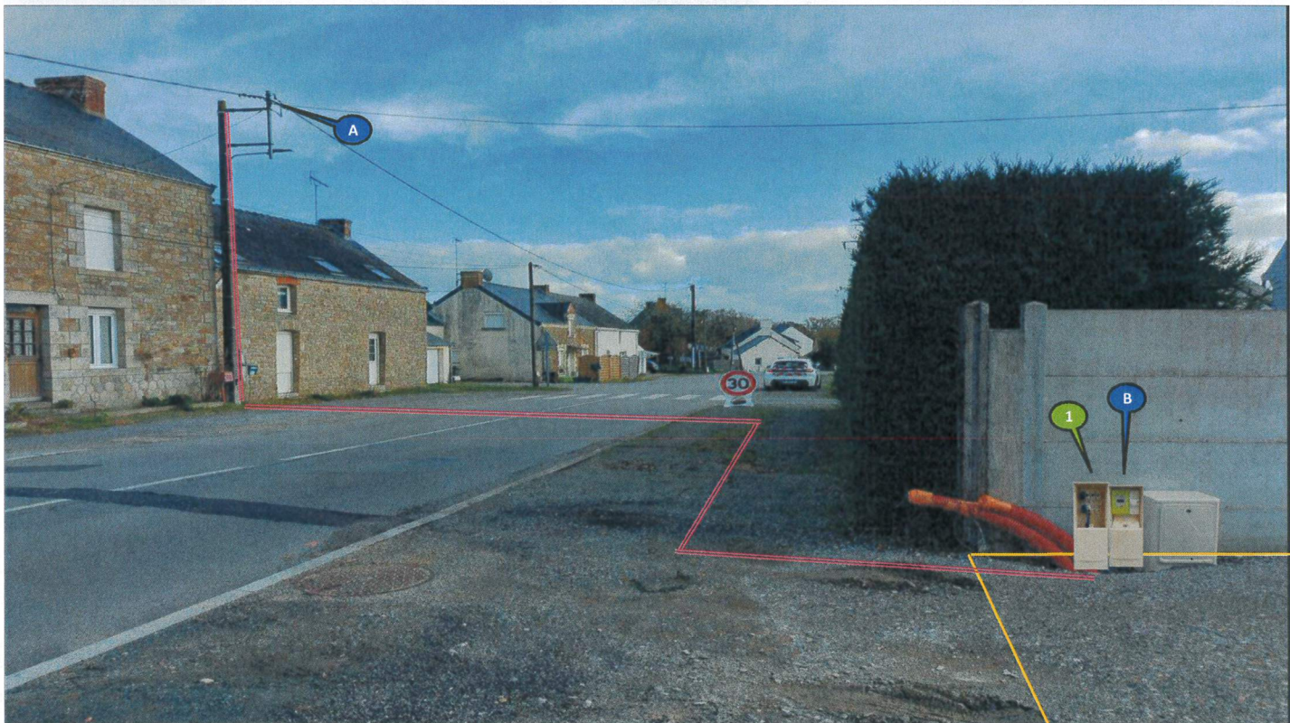
La solution technique est déterminée dans le respect de la norme NFC 14-100 en vigueur. Photo compteur non contractuelle